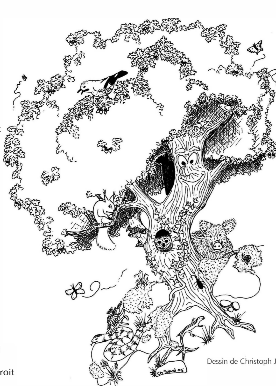
Dessin de Christoph Junod, © 2005

Le chêne n'a pas seulement son importance pour l'être humain, il est indispensable pour d'innombrables espèces de plantes et d'animaux. Il serait capable d'héberger et de nourrir près de 1000 espèces d'êtres vivants au cours de sa vie, ce qui fait de lui l'un des piliers écologiques de notre écosystème forestier.